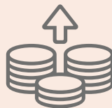
Rente & Vermögensanlage