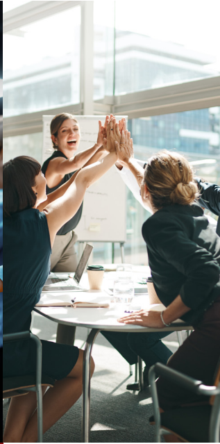
Unternehmens- beteiligung Private Equity