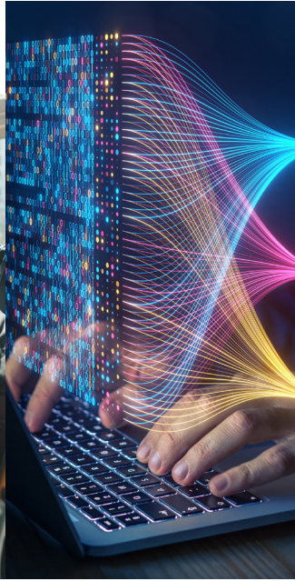
Alternative Strategien Alternative Strategies

NEUE WEGE GEHEN MIT ALTERNATIVEN INVESTMENTS