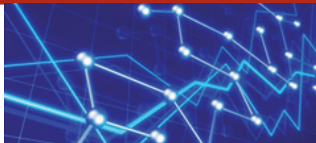
Tabla del perfil